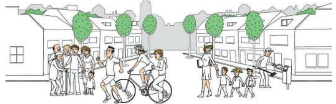
{UW MENING INBEGREPEN} Warm Looi